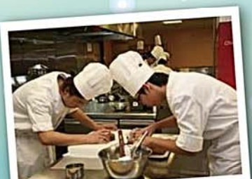
修讀西餅製作課程，學習西式糕點的烹調技巧