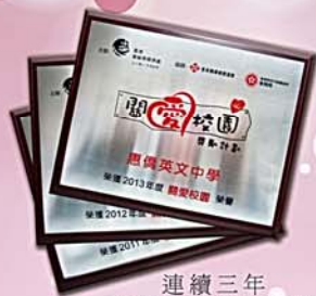
連續三年 榮獲關愛校園榮譽

本校在推動及支援學生全人發展方面不遺餘力，積極營造一個朋輩互助、師生互愛、家校關懷的校園社區。除校園內的「新生適應活動」、學長與學弟妹們共處相交的「朋輩輔導活動」、老師與中六同學的「師徒計劃」外，更延續家校同心的優良傳統，積極推行「家訪文化」，讓老師與家長就學子情況有更多瞭解及溝通，使他們能獲更多方面的照顧與支援。本校更連續三年獲教育局頒發「關愛校園」殊榮，正正顯出本校在推動關愛文化及學生支援上的種種努力及成果。