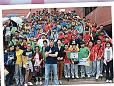
校長與學生一同參與 仁愛堂步行籌款