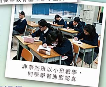
非華語班以小班教學，同學學習態度認真

本校充份明白每位學生在學習上有着不同需要，必須因材施教，方達致理想的學習成果。所以早在學期初，對SEN學生、非華語學生、資優生及中五、六學生逐一進行評估，作出針對性部署，提供各方面適切的協助及支援。每次測考後也會進行持續性評估以作跟進，進一步瞭解學習進度。各科在設計課程時，亦安排不同難度的學習任務，務求讓每位學生都能從學習的過程中獲得滿足感。