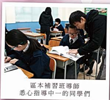
區本補習班導師 悉心指導中一的同學們