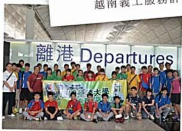
廈門華僑大學體育夏令訓練營