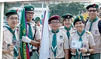
本校童軍及深資童軍連續四年獲得九龍地域頒發的傑出旅團獎