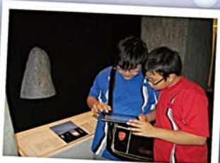
於太空館內運用iPad 搜尋資料