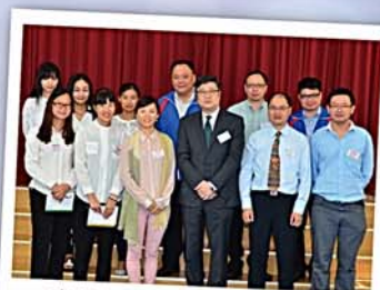
惠陽太陽島中英文學校 副校監及老師訪問本校

本校先後與國內多所學校結盟為姊妹學校，包括惠州市第一中學、廣州市天河中學、廣州市第七十五中學、北京育英中學、惠陽區及大亞灣區多所中學。本校亦與台灣義守大學結盟，藉此為兩地學校創造更多的交流機會，讓各師生在學術上互相學習，更多認識不同地域文化，擴闊視野及增廣見聞，亦增進教師的專業教學能力，推動課研文化。