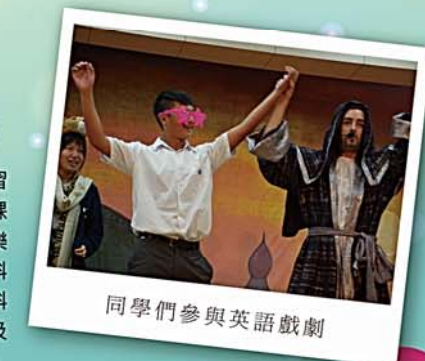
同學們參與英語戲劇

英文科經常與校外機構合作，為學生提供多元且難忘的學習經歷。例如與Chunky Onion Production 合辦英語戲劇欣賞課程，以阿拉丁神話為主題，更邀請老師與學生一同上台演出，樂也融融。Synergy Education也是其中一個合作機構，攜手在科學及人文學科改革課程，研製出校本教材，讓學生除了學習該科的知識外，認識到相關的英語。本年度英文科亦與教育局及EL2100 Limited合作，在中一現有的英文課程裡實行課程改革，推行校本的英語閱讀計劃。