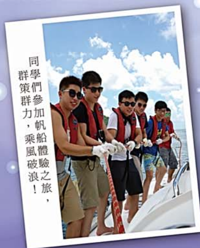
同學們 群策群力， 帆船體 破浪之旅！