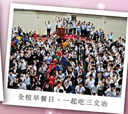
全校早餐日，一起吃三文治