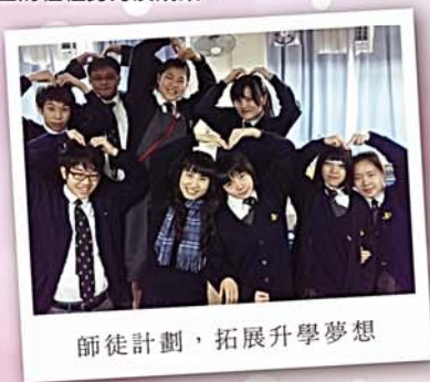
師徒計劃，拓展升學夢想