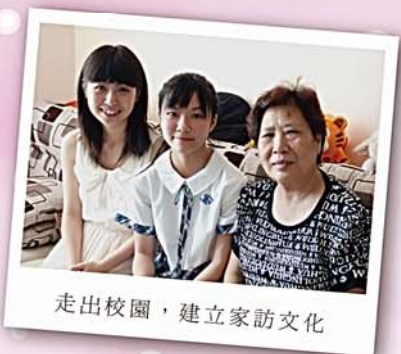
走出校園，建立家訪文化