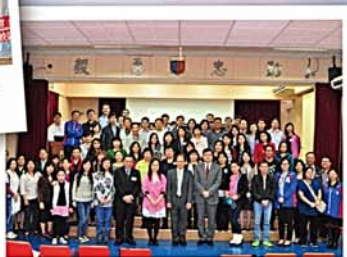
第十二屆家長教師會就職典禮 暨會員大會大合照