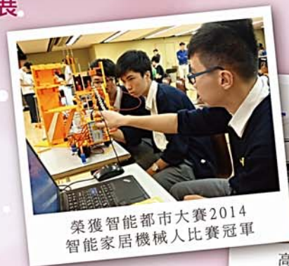
榮獲智能都市大賽2014 智能家居機械人比賽冠軍

本校課程發展組貫徹多元化的辦學理念為基礎，積極培養學生的自學能力，致力提高學生的學習興趣，使其有效運用資源進行學習及改善學習。透過與不同協作機構舉辦多元化的「增潤課程」，包括「提升學習技巧課程」、「黑暗中對話體驗」、「生涯規劃課程」、「智能機械人課程」、「科學實驗工作坊」、「高中科研計劃」、「支援資優學生計劃」等。讓學生在各方面有均衡的發展，培養學生共通能力及發展潛能。