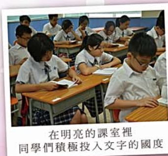
在明亮的課室裡 同學們積極投入文字的國度