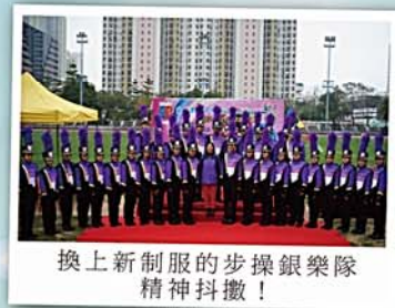
換上新制服的步操銀樂隊精神抖擻！

「一人一藝」計劃中，每位中一、二級學生必須參與一項藝術活動，範疇涵蓋音樂、舞蹈、視覺藝術、戲劇、校園電視台及攝影。同學透過全面而均衡的藝術活動，發展多元智能，提升藝術情操，培養終身興趣。