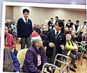
學生探訪長者中心

義工活動培養學生服務社區、回饋社會的精神。本校每年安排學生探訪長者日間中心、智障中心及深水埗區獨居長者。學生在義工活動上表現出色，深受各機構及受助者讚賞。近年更有不少學生參加海外義工服務，前往越南及緬甸等地服務當地居民，學生從中獲益良多。