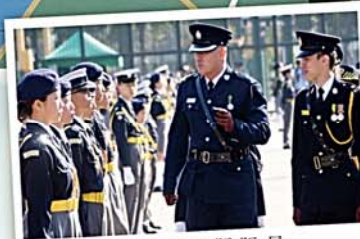
交通安全隊隊員接受警察指揮官檢閱

制服團隊是惠僑一大特色。中一學生必須加入香港少年領袖團、童軍、深資童軍、香港聖約翰救傷隊少青團或香港交通安全隊其中一隊作訓練。學習內容相當豐富，包括急救、野外求生、繩結、原野烹飪、步操、交通控制及攀石等。