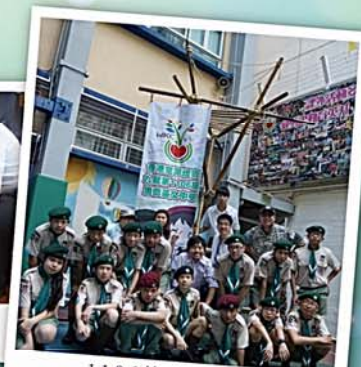
1106旅上下一心築起了兩層高的瞭望台