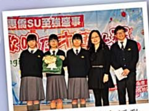
家教會資助學生會活動 並頒獎予得獎學生