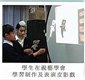
學生在視藝學會學習制作及表演皮影戲