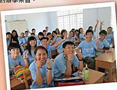
越南義工服務計劃

為配合教育改革的建議，達至多元學習的體驗。本校每年均會舉辦多次「世界學堂計劃」，帶領學生前往具代表性且富有教育意義的城市。透過實地考察，同學可認識當地歷史、文化、風土民情、地方經濟、社會結構，以瞭解各地人文情懷，增廣見聞。學校期望每位學生在學期間，最少擁有一次前往海外考察的機會，達至「懷抱祖國，放眼世界」的辦學宗旨。