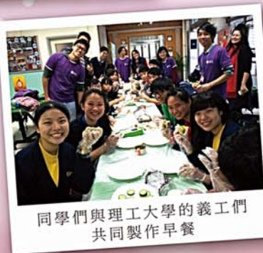
同學們與理工大學的義工們 共同製作早餐

閱讀是學習的基石，更可修心養性，所以初中級課室內設有「課室圖書館」，讓學生在早讀課時翻閱。本校亦與公共圖書館合作推行各項「閱讀獎勵計劃」，如「青少年讀書會活動」讓學生與人分享閱讀的樂趣，改善思維和溝通技巧，養成良好閱讀的習慣。早會上又增設「打開心窗」的環節，為同學們介紹一些有意義的小故事，讓學生藉着閱讀，打開通往世界的窗口。