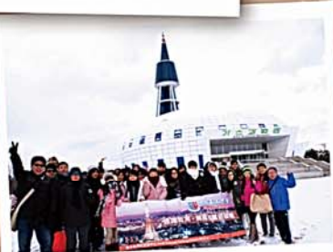
韓國首爾通識及藝術研習之旅