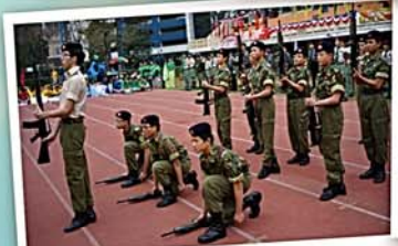
香港少年領袖團花式持槍步操表演

高中學生可選修與職業領域緊密關連的「應用學習課程」。同學考獲「達標」將被接納為文憑試第二級成績，而考獲「達標並表現優異」更被接納為達到第三級或以上成績。同學利用周六及暑假參加有關課程，從中學到與工作相關，且具實際價值的技能，如髮型設計、西餅製作、化妝等，同學能在生活應用之餘，亦增加了日後求職的自信心。