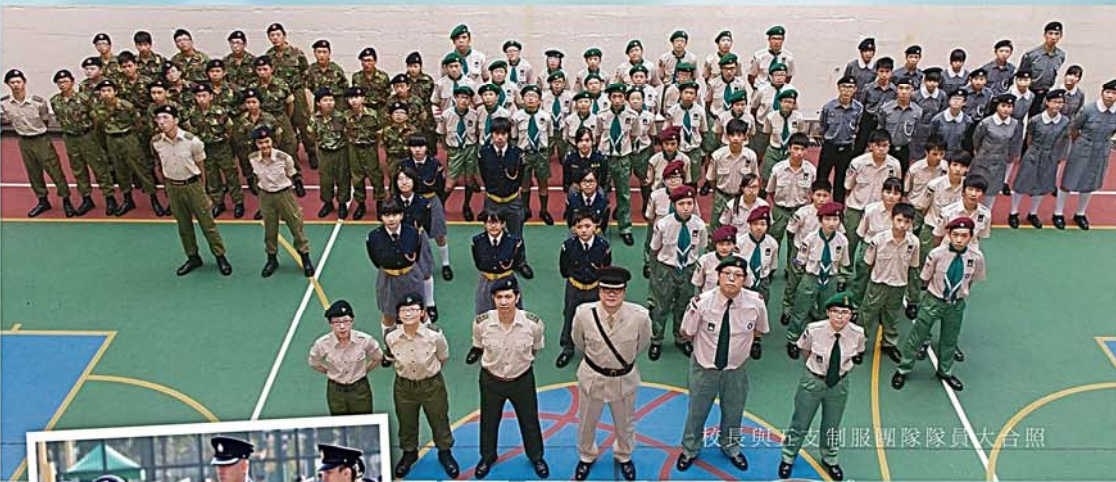
校長與全支制服團隊隊員大合照