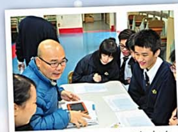
在模擬放榜中，社工向中六 同學進行出路分析