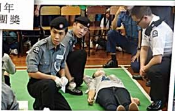
同學們經過多次練習後在急救比賽中表現出默契