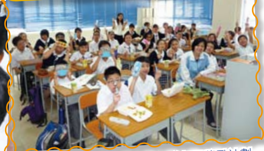
健康校園計劃 — 環保午餐餐具獎勵計劃