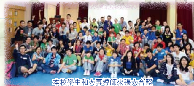
本校學生和大專導師來張大合照

本校連續兩年參加由樂火青年網絡（U-Fire）主辦的「傳薪領袖服務計劃」。計劃特殊之處，是惠僑的同學會獲配一位大專生，作為他們的「成長嚮導」，導師主要來自香港科技大學、香港城市大學及香港大學等。透過網絡及活動提供生命輔導，幫助同學建立良好的價值觀，及早計劃未來。本年有四十八位中一同學參加此活動。