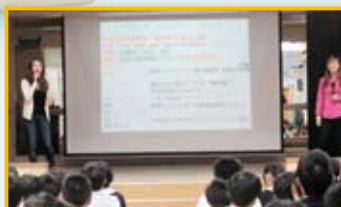
「愛自己、活得起」預防青少年援交講座——講員講解詳盡，例子生動有趣。

這個世界有許多誘惑，其中包括金錢的誘惑，有些人甘願為錢財做牛做馬，甚至出賣身體，誤入歧途，愈陷愈深，我們應引以為鑑，不要因小失大，要用正確的金錢價值觀來衡量是非對錯。