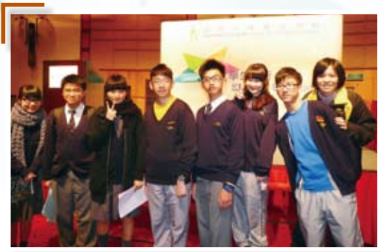
本校香港資優教育學苑學員合照

去年，本校共有10名在人文學科、數學、科學或領導才能等方面均有優秀突出表現的學生獲取錄參加香港資優教育學苑各類型的資優課程，是次計劃旨在讓學生參與多元化的課程和活動，培養學生不同方面的智能發展，提升自信心及專科能力。本年，本校更參與教育局優質教育組舉辦的「資優教育夥伴學校網頁」計劃，為資優學生提供適當的課程，發掘他們的個人潛能，藉資優學生互相交流學習經驗的機會，擴闊他們的視野。