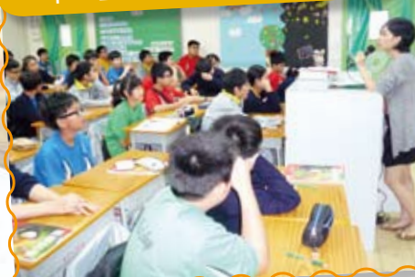
健康校園 — 中一至中三預防濫藥活動