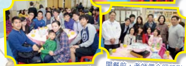
開餐前，老師們合照留影。