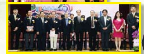
主席與台上嘉賓大合照