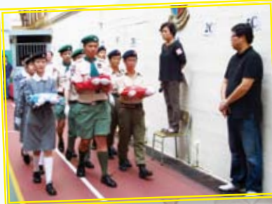
本校制服團隊負責一年一度的國慶升旗儀式

三年的童軍生活中，我最喜歡的是宣誓營，因為我在營舍裏學習到甚麼是團隊精神，還增進了隊員之間的友誼。不過，最令我深刻的活動是在剛過去的六月，本團參加的深水埗區童軍步操比賽，我負責持旗，十四位隊員在比賽前一個月便已開始練習，縱使未能贏取任何獎項，但我與其他隊員一起奮鬥，已留下美好的回憶。