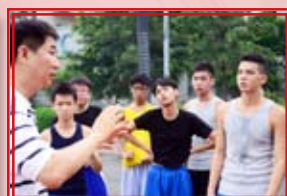
籃球教練講解技術