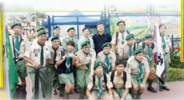
鄭智賢校長與區總監和本校童軍團成員合照