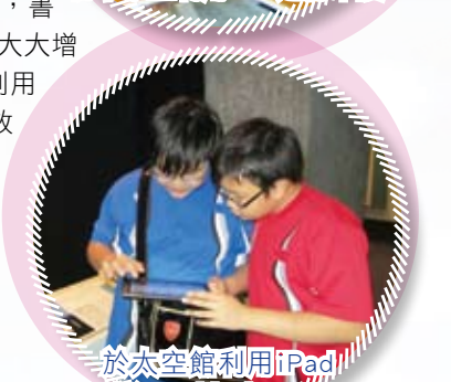
於太空館利用iPad進行即時探索