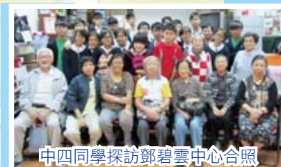
中四同學探訪鄧碧雲中心合照

班際義工活動探訪了鄧碧雲長者中心、扶康會上李屋、白田康齡長者中心、李嘉誠護理安老院及探訪石硤尾邨獨居長者等。同學熱心及積極為他們表演，一起參與遊戲及面談，使他們有一個歡樂的下午。在義工活動上，同學表現出色，深受機構及長者讚賞，同時獲社署頒發獎狀嘉許他們的努力付出。而中三至中五同學則參與賣旗活動，藉此協助社福機構籌募經費推動慈善活動。