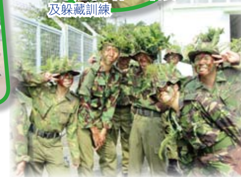
軍事趣味學習 — 一齊花面貓