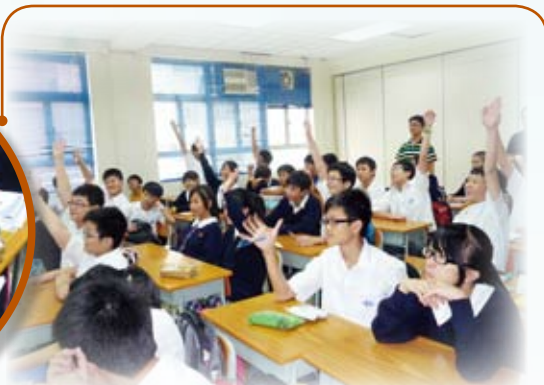
中一讀書有法課程，同學們踴躍回答問題