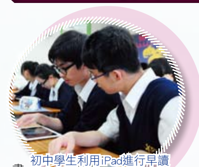
初中學生利用iPad進行早讀

今年，初中便利用iPad推行早讀計劃，書庫藏有多達百本的書籍，利用iPad看書，大大增加學生的閱讀興趣。除此之外，本校更利用iPad進行戶外全方位教學活動，其教學效果顯著，有效地將學生的學習範式轉移至以學生為中心，學生可根據自己的特質和進度來學習。