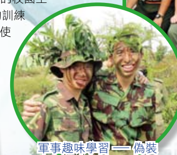
軍事趣味學習 — 偽裝及躲藏訓練