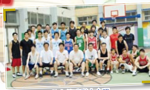
校友籃球隊大合照