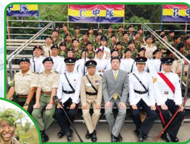
校長、導師與應屆畢業隊員合照

在訓練期間，我發現AC有更多的優點，例如，AC式的步操、露營、玩繩網等活動都使我的校園生活更加精彩和多元化。而且，每次的訓練與活動，都能鍛煉我的體能和意志，使我更獨立、自信和積極。