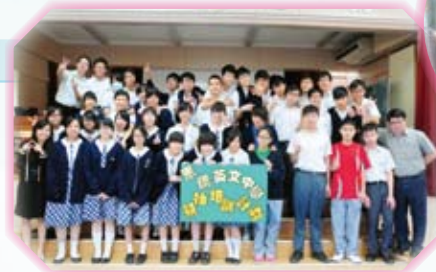
領袖培訓計劃大合照

輔導組與香港青年協會籌辦「中四級全方位領袖培訓計劃」，藉此提升學生的領袖才能，讓他們建立自信心。透過不同的群體及小組活動，同學學懂解難及協作精神，亦從中反思自己的強弱項，找出最合適自己的領袖風格，為將來在學校或社會擔當領導角色作好準備。