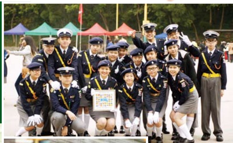
交通安全隊在分區操中勇奪第三名

屈指一數，今年是我在惠僑渡過的第五個年頭，也是在交安渡過的第五年。看著那五張制服照，卻是百般滋味在心頭。回想起中一那年，我是個自律和責任心也欠奉的初中生，但在眾師兄師姐的鞭策下，我學懂自律、負責的重要性。今天，成為師兄的我，除了不忘在隊中向新隊員宣揚隊訓「謹慎禮讓」的重要性外，也和隊員一起學習和傳承前人精益求精的精神，令惠僑交通安全隊的隊員不單重視道路安全意識，也懂得品德對人生的重要。直至今日，我慶幸自己中一時選擇加入交安，更感謝交安多年來給我學習的機會，使我在中學生涯能留下一頁又一頁動人的回憶。