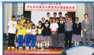
本年度我校與香港四邑商工總會新會商會學校成為配對學校

第一次與小學生共同參與歷奇活動。在遊戲過程中，我們所有中、小學生共融互勉並積極投入，從中我學懂什麼叫認真投入和責任，更建立個人自信，為我將來投身社會作出準備。