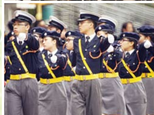
交安隊員步操非常整齊