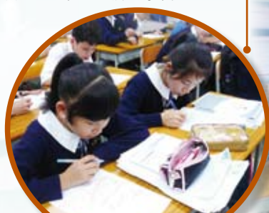
中一讀書有法課程，同學們認真地做練習題

本年邀請專業培訓機構為中一級同學舉辦「提升學習技巧課程」，協同學掌握學習技巧，提升其學習興趣，強化自信心。此外，「應試技巧」及「通識議題寫作及訓練」等課程亦繼續舉辦，指導高中同學解難策劃方法、目標設定及考試技巧等，培養同學批判思考，為他們面對公開試或升學前作好準備。