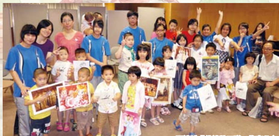
閱讀城「伴讀特工隊」故事分享

為培養同學有良好的閱讀習慣，本校於初中除推行「課室小圖書館計劃」，又於初中試行以iPad電子書，閱讀中文經典名著及著名英文小說等，提高學生對閱讀的興趣。此外，本校又繼續與香港閱讀城及公共圖書館合作，推行各類型的「閱讀獎勵計劃」，如「閱讀大使計劃」、「讀書會活動」、「伴讀特工隊」等，與同學分享閱讀的樂趣。