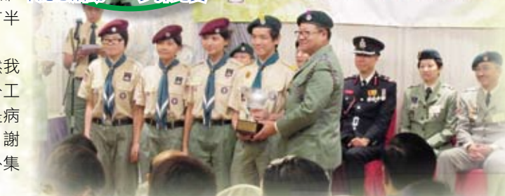
第三屆區總監盃深資童軍錦標賽冠軍