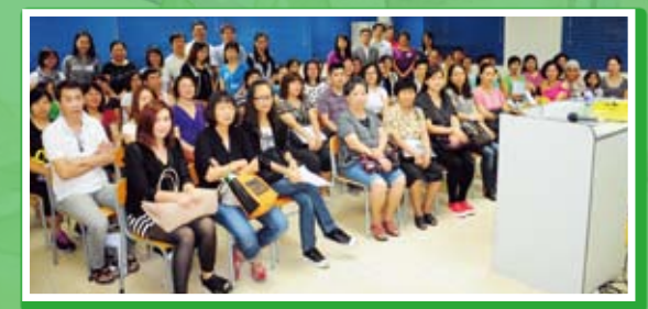
「升中伴你行」講座，讓家長更了解學校與子女

為讓家長更瞭解子女升中面對的挑戰，進而協助子女適應，家教會及社工黃姑娘特別安排中一級家長講座——「升中伴你行」，內容圍繞辨識子女初中生活適應困難及其處理方法，中一家長均踴躍參與，期望子女能有愉快的中學生活。