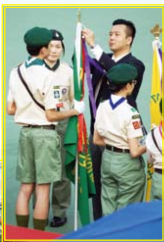
童軍團連續三年獲得香港童軍總會九龍地域頒予傑出旅團獎項