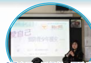
「愛自己、活得起」預防青少年援交小組——在各班中透過小組討論、影片及真實個案分享，向同學灌輸對「性」的正確價值觀。

學生面對不同價值觀的衝擊，不免感到困惑，為此輔導組積極推行生命教育計劃，提高學生對事物的判斷能力，使他們能夠抱持正面的價值觀和積極的人生態度，學會辨別是非。今年舉辦的活動包括「愛自己、活得起」預防青少年援交講座及小組活動，藉以加深學生對援交的認識，並讓他們對「性」持有正確的價值觀。此外，「預防濫用藥物」及「愛·清新」健康無煙校園講座，亦讓學生明瞭毒品及吸煙的禍害，使其遠離毒品煙草、避免濫藥，共建一個健康和諧的校園。