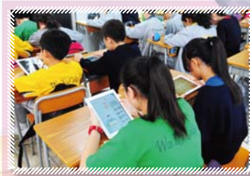
iPad藏著不同種類書籍，大大增加學生的閱讀興趣

香港教統局亦提倡電子教材，將傳統課本學習形式轉移至數碼教室的學習，加上坊間有不少關於學習的程式 (Apps)，有助學生提升他們的學習動機。惠僑為回應香港教育局政策，開展21C eLearning新架構的發展方向，購買了五十部iPad作教學之用。