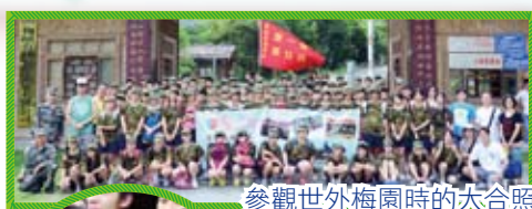
參觀世外梅園時的大合照

這三天艱苦的訓練讓我明白了做任何事都要勇敢地迎難而上，面前的挑戰只是我們把它想像得過於困難，只要有恆心，鐵杵也可以磨成針。