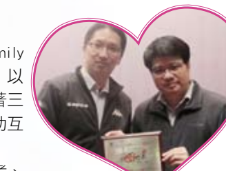
本校再度榮獲「關愛校園獎勵計劃」「關愛校園」榮譽

本校的努力更獲得香港基督教服務處樂Teen會頒發「關愛校園獎」。此獎項是由學者、教育界代表、社會服務界代表、家長代表及學生代表選出，公開表揚積極推廣及實踐關愛文化及表現突出的學校。