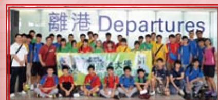
離港前在機場大合照