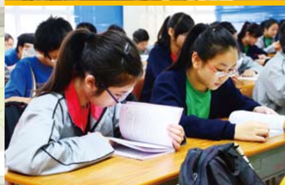
課室小圖書館計劃，同學們專心地閱讀

為培養同學有良好的閱讀習慣，本校於初中除推行「課室小圖書館計劃」，又於初中試行以iPad電子書，閱讀中文經典名著及著名英文小說等，提高學生對閱讀的興趣。此外，本校又繼續與香港閱讀城及公共圖書館合作，推行各類型的「閱讀獎勵計劃」，如「閱讀大使計劃」、「讀書會活動」、「伴讀特工隊」等，與同學分享閱讀的樂趣。