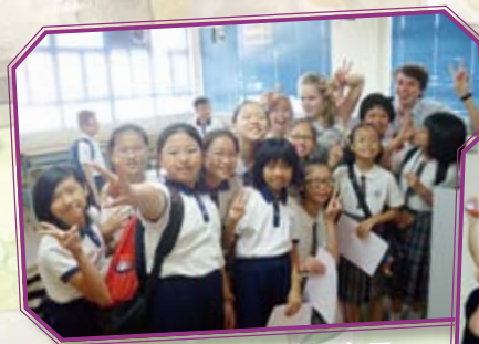
兩位導師與小學生合照