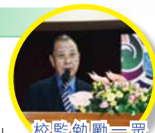
校監勉勵一眾畢業同學

二零一一至二零一二年度畢業典禮暨頒獎禮於二零一二年五月二十四日，在本校禮堂舉行，當日荷蒙深水埗區議會主席郭振華MH太平紳士主禮，致辭及授憑，並邀得校監朱松勝MH、校董、友校校長、家長、校友及社會友好出席，一同祝賀畢業班同學前程萬里，場面溫馨熱鬧。