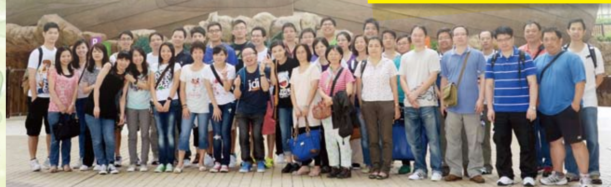
教師發展日 — 挪亞方舟之旅