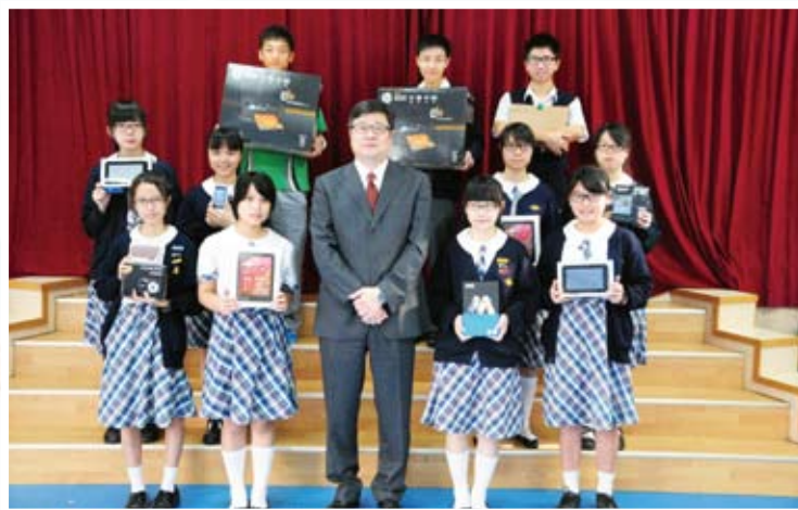
得獎同學與校長合照