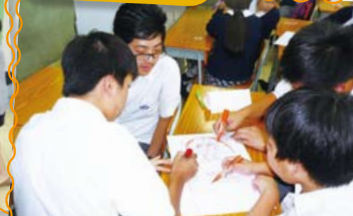
健康大使培訓分組討論