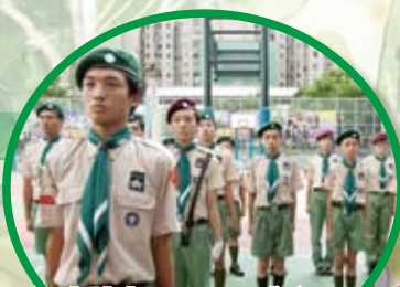
深水埗東區、西區成立20周年紀念活動——步操比賽

記得聖誕宣誓營中，我學會了很多在野外求生的技能。雖然我們紮的營都是東歪西倒的，但在紮營的限時中，我們都充份地分工合作。在那個寒冷的聖誕，我覺得很溫暖，因為期間我一直都是病著的，病得面青唇白，隊員都很關心我的情況，一直都照顧我。謝謝你們！回想起這一年，雖然上學期步操好辛苦，但下學期戶外集會活動卻很好玩，很開心。明年要繼續留在深資童軍成長呢！