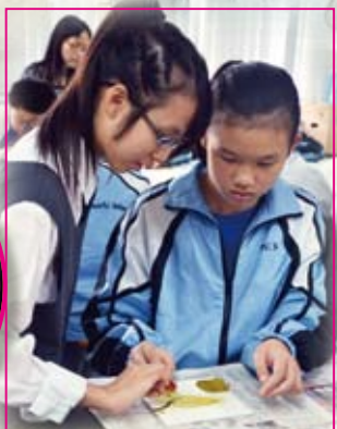
小學科學日營 — 製作「葉脈書籤」