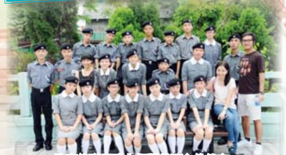
比賽後隊員臉上都掛著開心的笑容