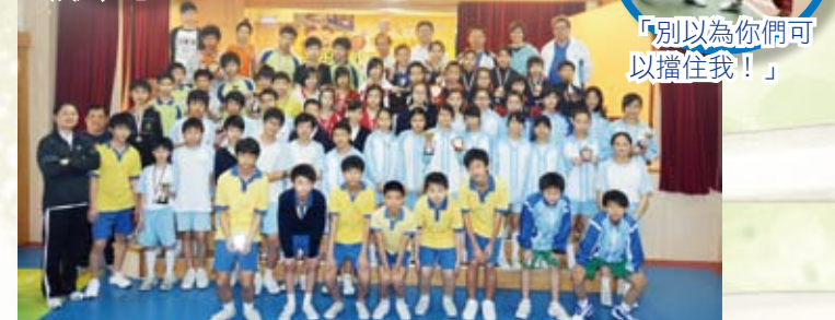
八所小學的學生齊齊整整拍大合照