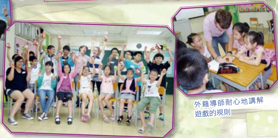
外籍導師耐心地講解遊戲的規則