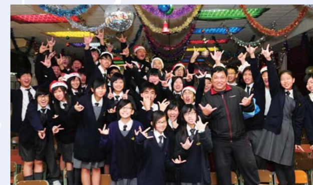
聖誕佳節師生同賀

2009年度聖誕聯歡會圓滿完成，並在同學腦中海留下美好回憶。今年活動仍然由課外活動組活動大使主持，長江後浪推前浪，從第一屆到現在第三屆，活動愈辦愈精彩，尤其是一些以班際團體形式進行的活動遊戲，如：鬥大聲、估歌仔、估相片等，贏得師生一致的歡呼聲和喝彩聲。我們期待活動大使於下學期為大家送上更多歡樂，源源不絕。