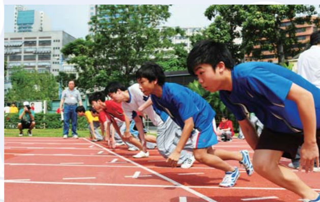
起跑了，向着終點進發！