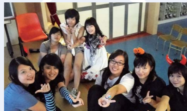
萬聖節派對籌備委員合照

為了向惠僑廣大同學提供更多福利，學生會幹事成功爭取加入福利聯盟。購物優惠咭已陸續送到同學手中，希望優惠能減輕消費負擔。