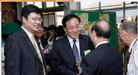
各界友好蒞臨支持四十周年開放日

2009年度是惠僑英文中學創校四十周年。對師生來說，是繁忙的一年，充實的一年，值得紀念的一年。而對我來說，更是滿載欣悅與激動的一年。四十年了！我委實非常高興能夠與各位同學一起經歷這個歷史性時刻。