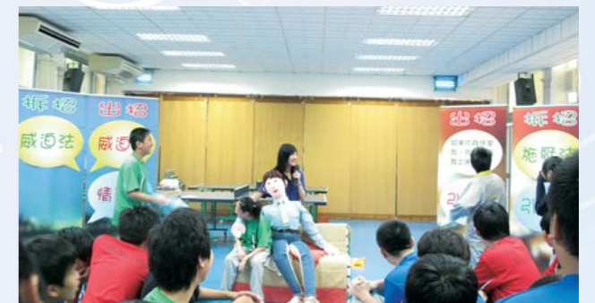
性教育互動工作坊

在「和諧校園」方面，輔導組透過各班師生的共同努力及協作下，凝聚「惠僑一家人」的關愛文化，推動彼此認識及接納，從而增加歸屬感及建立和諧校園氣氛。本年度舉辦的活動有「班際禮貌比賽」、「禮貌之星」選舉活動、「事事講禮」標語創作比賽，提醒同學在日常生活注意禮貌的重要性，並以禮待人；其他如「迪士尼同樂日」、「朋輩輔導」計劃、「高年級師徒計劃」、「Cooking Mama美食製作班」及各級家訪等，都是透過活動以建立更和諧的關愛校園，並對學生作出更適切的輔導及支援。