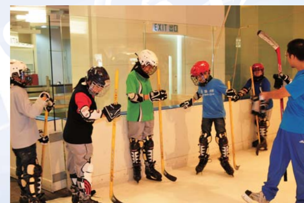
惠僑一支新隊伍成立