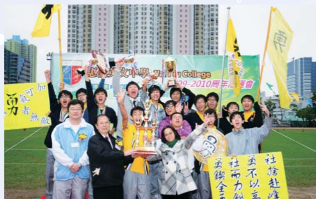
勇社由校監及校長手上接過大獎，興奮萬分