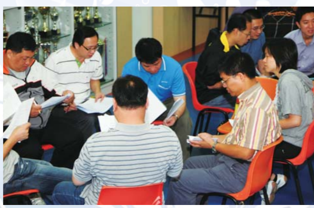
教師發展日——「青少年濫用藥物知多少」