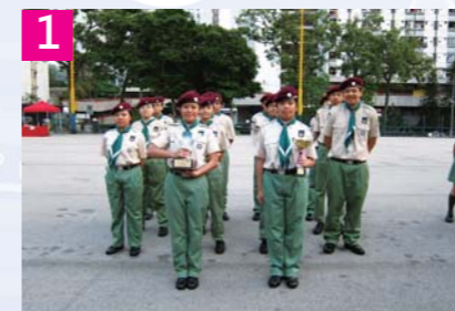
1. 在「深資童軍錦標賽」中，惠僑奪得全場總冠軍及分站冠軍

惠僑童軍隊屬香港童軍九龍第1106旅，於2000年3月成立，至今已歷九載，旨在透過富挑戰的訓練，促進青少年身心精神之發展，使之成為良好公民，貢獻社會。我們以「童軍誓詞」與「規律」為本，以童軍格言「準備」為綱領，讓成員在任何時間均保持準備狀態，自律自發處理好任何事情。今年，我們舉辦了一些戶外活動，如露營、遠足、小隊長訓練以及其他探險活動。同時，童軍團亦參加了不少專科徽章訓練及考試，以期提高團隊質素。我們團員的自信心、耐力及各方面童軍技能增進了不少！