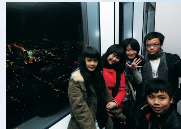
本年度「世界學堂」來到台灣，兩岸三地之文化盡體驗