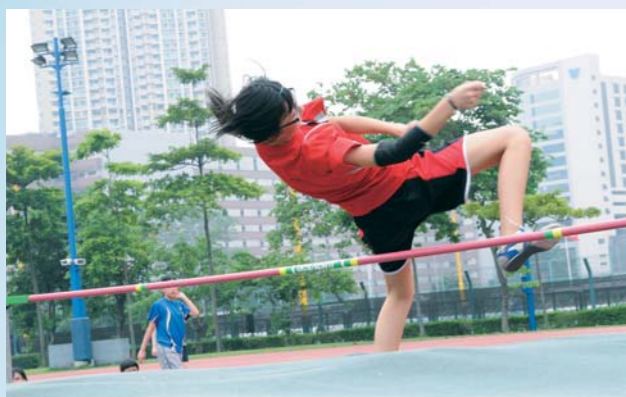
同學身輕如燕，跳得游刃有餘

2009香港東亞運動會是全香港的盛事，惠僑承蒙民政事務署贈送火炬，在本年度校運會期間作火炬傳遞，讓師生上下率先體會東亞運熾熱的體育氣氛。當天，學生、家長、老師、校長及校監均有參與，每個火炬手都精神奕奕，手持火炬昂首闊步，將堅毅不屈的信念薪火相傳。全校都熱烈投入傳遞過程中，不斷為火炬手歡呼打氣，情緒高漲。