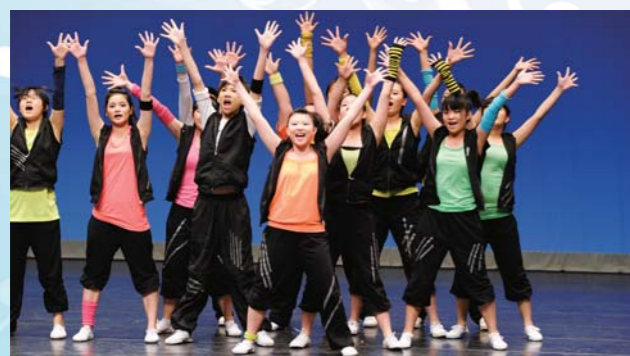
惠僑舞蹈組在校際舞蹈節中獲得爵士舞甲等獎