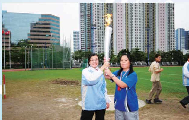
師生同心傳遞東亞運動會火炬