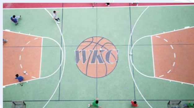
操場塗上新的圖案