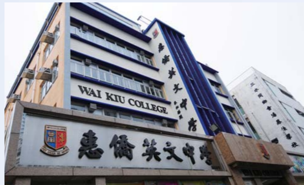
校舍配上新的顏色更見精神奕奕