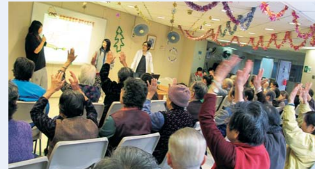
火鳳凰義工計劃—義工長者服務

在「個人成長」方面，輔導組推行一系列的活動，其中如「中一迎新歷奇營」及「各級迎新活動」，讓學生盡早投入校園新生活。為建立學生正面積極的自我形象及人生觀，我們還舉辦了「藝術在社區——一人一故事劇場」、「戲若人生——防止青少年吸毒演員培訓計劃」、「共創成長路計劃」、「新移民適應計劃」、「自強計劃」及「火鳳凰計劃」等，讓學生能發揮自我潛藏能力，學會自力更新，勇於承擔的精神。