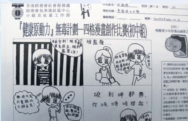
《畫出彩虹·遠離毒害》四格漫畫比賽