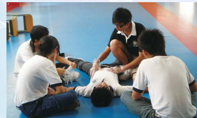
聖約翰救傷隊少青團在禮堂進行急救練習