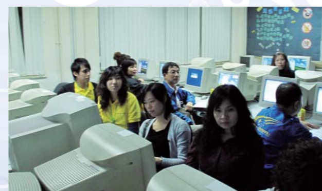
e世代家長講座，教導家長學用電腦，與子女溝通