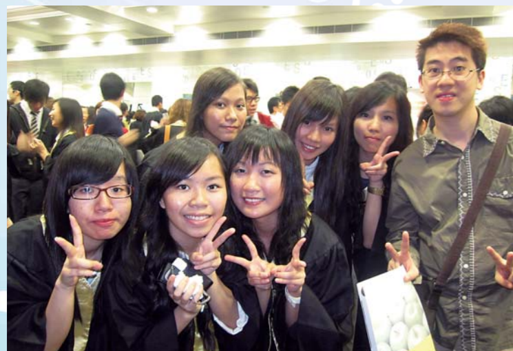
參加應用學習課程，不單學到工作技能，更可獲取認可資格

首屆新高中應用學習課程亦將於2010/11 學年開展，學生可以在中五時選擇「應用學習課程」作選修科目，總課時為180 小時。成功修畢的學生，其成績將記錄在香港中學文憑證書上，表現優異者更可視作文憑試科目第三等級成績。