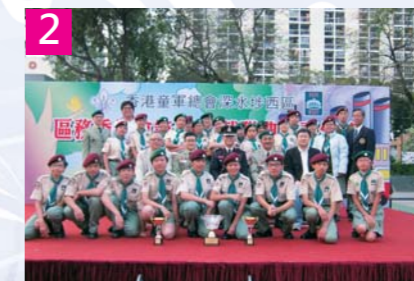
2. 童軍團在今年深水埗分區香港童軍比賽中獲多個榮譽