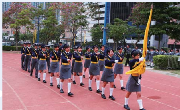
成功之道就在萬眾一心，一起朝着同一目標邁進！