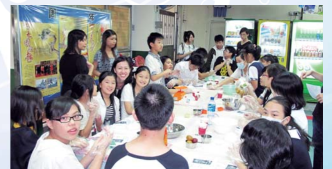
Cooking Mama遊戲，師生齊來參加冰皮月餅製作班

在「和諧校園」方面，輔導組透過各班師生的共同努力及協作下，凝聚「惠僑一家人」的關愛文化，推動彼此認識及接納，從而增加歸屬感及建立和諧校園氣氛。本年度舉辦的活動有「班際禮貌比賽」、「禮貌之星」選舉活動、「事事講禮」標語創作比賽，提醒同學在日常生活注意禮貌的重要性，並以禮待人；其他如「迪士尼同樂日」、「朋輩輔導」計劃、「高年級師徒計劃」、「Cooking Mama美食製作班」及各級家訪等，都是透過活動以建立更和諧的關愛校園，並對學生作出更適切的輔導及支援。