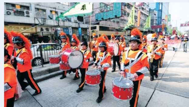
看！銀樂隊的成員多英姿颯颯

本校獲得深水埗體育會邀請參加「深水埗東亞運動會飄色巡遊嘉年華」。當天早上，30多名步操銀樂隊帶領一眾嘉賓，由深水埗楓樹街球場出發，以整齊的步伐，奏起悠揚的樂曲，經黃竹街、元州街等，然後返回楓樹街球場。銀樂隊所到之處，街坊們均以掌聲支持，所以，縱使同學們演奏得揮汗如雨，依然未減興致。除此之外，本校亦派出約20名制服團隊隊員在巡遊時協助維持秩序。