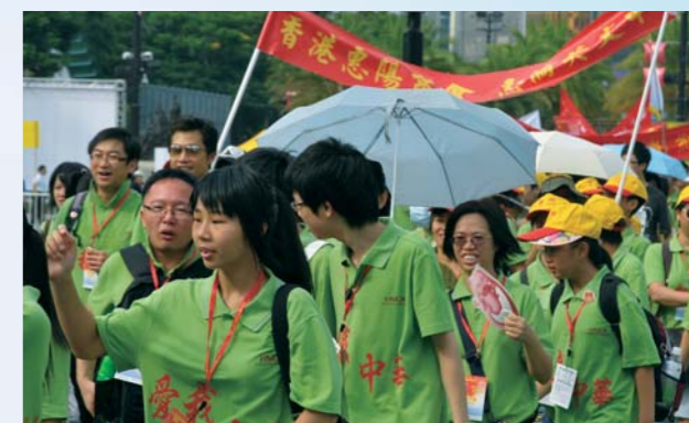
惠僑師生浩浩蕩蕩起步千萬行