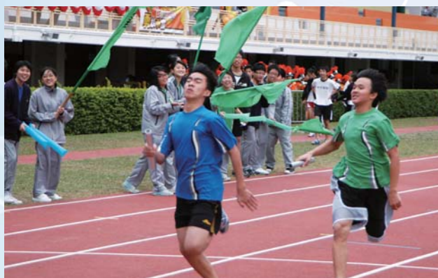
每位健兒都用竭盡全力爭取勝利