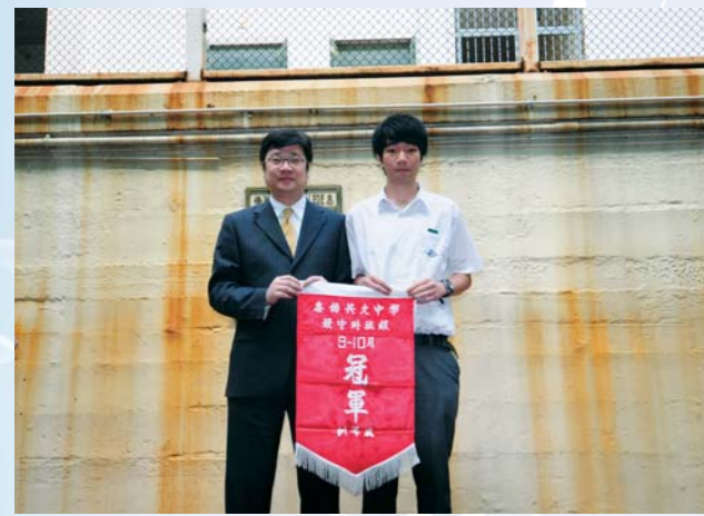
6A班同學於守時比賽中取得冠軍，獲校長嘉許

我們明白，學生的成長並不是一朝一夕的，途中必定經過艱苦的磨練，穿過迂迴漫長的道路。不過，惠僑每位老師都能貫徹始終，相信學生一定會明白我們的苦心，學習成為一位自律積極的人。