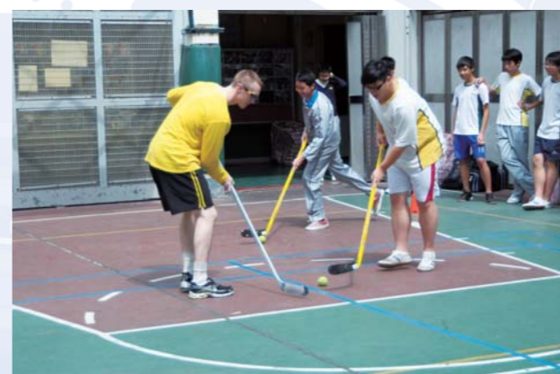
外籍教練到校推介冰上曲棍球

自去年香港冰球訓練學校到本校推廣「冰上曲棍球」後，校園內掀起一股冰曲熱潮。開始時候，部份參加同學只懂溜冰，更有部份同學連溜冰也不懂，但經過一段艱辛的訓練後，他們已對這活動產生濃厚興趣，更將組成惠僑校隊，參與學界比賽，期望這支新校隊能茁壯成長，長足發展。