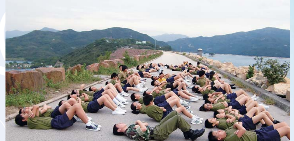
早上六時正，早操不會停！