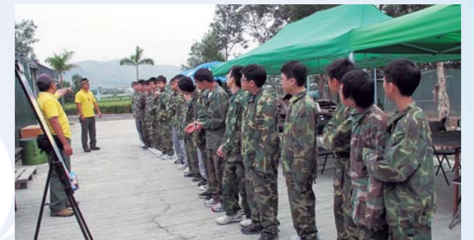
共創成長路—野外訓練

在「心靈健康」方面，面對著社會各種風氣的衝擊，「援交」、「吸毒」及「o靚模」文化湧現，不斷衝擊著新一代青年的心靈，故此，重建心靈健康，為他們作有力的屏障更形重要。本年度，輔導組參與的活動有「網絡齊關注行動2009——學界親親上網大行動」、「數碼『深』情社區教育計劃」、「健康原動力」無毒計劃四格漫畫創作比賽，讓學生加強對互聯網的認識，建立良好的上網習慣；更推行「性教育綜合計劃」及「晨光雋語」活動，以建立學生正確的價值觀及人生觀。