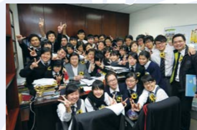
四十周年年宵攤位