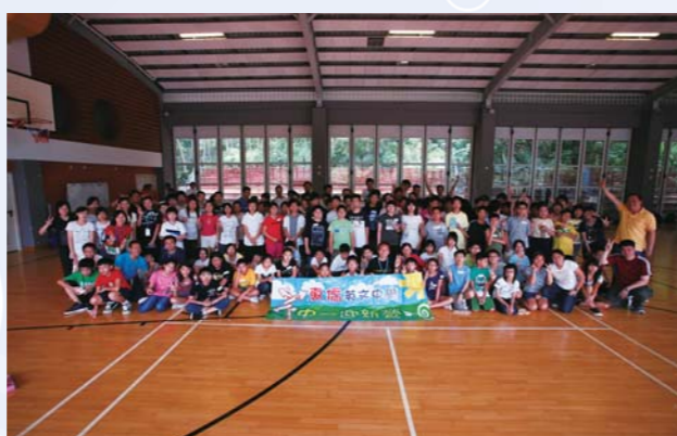
中一迎新歷奇營大合照