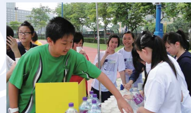
運動員力竭筋疲之際，這杯清水如同甘露