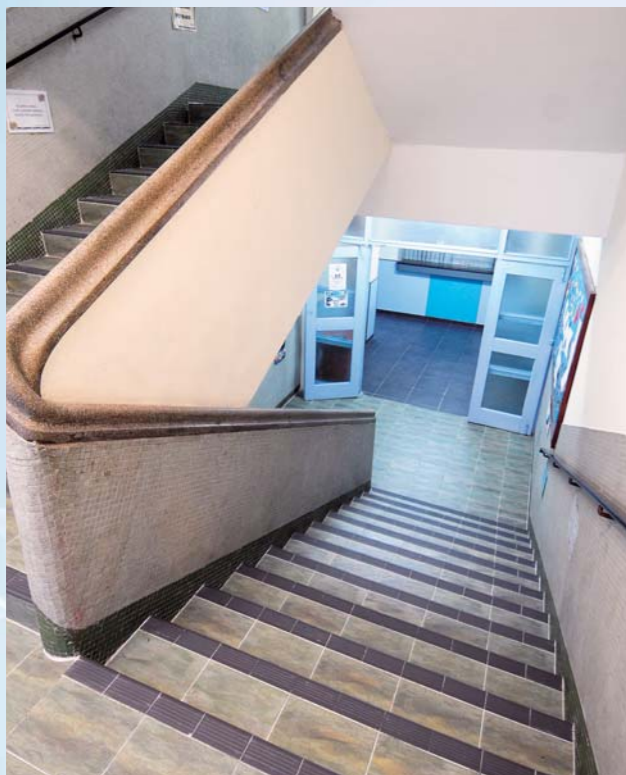
鋪上新地磚的前後樓梯，令梯間更寬敞舒適

惠僑剛渡過四十周年校慶，即是說學校已有四十年的歷史，不少地方的確實有翻新及維修的需要。隨著教育改革的推行及社會環境的不斷變遷，學校除了致力於維持高品質的教育質素外，優質的校內資源管理亦不可忽視，期望總務組的同事能肩負責任，為同學建立更優質的學校環境。