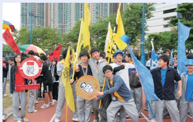
各社啦啦隊落力為健兒打氣