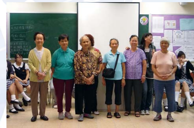
長者義工蒞臨惠僑，與6A同學分享義工經驗