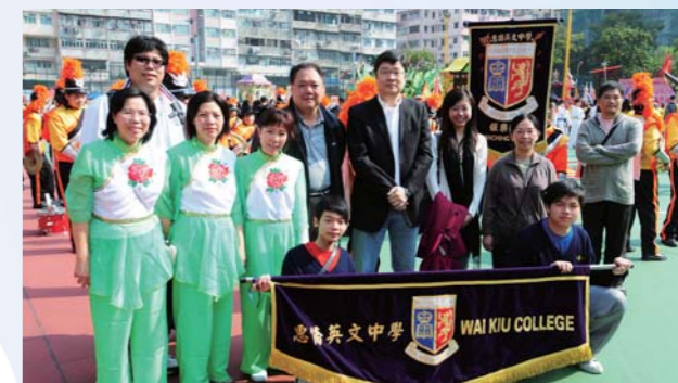
深水埗辦飄色巡遊，我校也派出了強大的隊伍參加