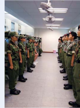
每朝也會做的睡房檢閱

香港少年領袖團惠僑分隊成立於二零零一年，自二零零八年一月成功升為C中隊後，得到更多資深教官們的教導，讓學員有更多機會學習和服務，參與的活動亦更多元化。除基本步操及有系統的團隊知識外，部分學員更能接受槍械步操、高繩網及水上活動訓練。