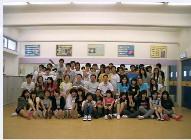
本屆領袖生參加兩日一夜訓練營後大合照留念