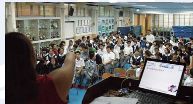
數碼「深」情社區教育計劃

在「心靈健康」方面，面對著社會各種風氣的衝擊，「援交」、「吸毒」及「o靚模」文化湧現，不斷衝擊著新一代青年的心靈，故此，重建心靈健康，為他們作有力的屏障更形重要。本年度，輔導組參與的活動有「網絡齊關注行動2009——學界親親上網大行動」、「數碼『深』情社區教育計劃」、「健康原動力」無毒計劃四格漫畫創作比賽，讓學生加強對互聯網的認識，建立良好的上網習慣；更推行「性教育綜合計劃」及「晨光雋語」活動，以建立學生正確的價值觀及人生觀。