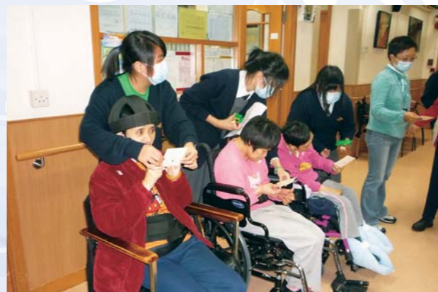
3B全班同學探訪扶康會，與智障人士玩遊戲

本年度班際義工主要在星期三多元活動堂進行，班主任帶領學生到不同社福機構探訪，如九龍塘頌恩護老院和扶康會成人中心。同學無論是和老人，還是智障人士相處，都表現投入，氣氛和諧融洽。除此之外，今年本會更與學校附近的鄧碧雲日間護老中心合作，由長者義工與同學一起探訪石硤尾及白田邨的獨居長者，意義深遠。