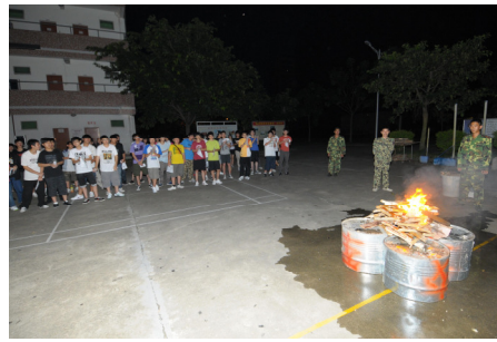
學生在營火會上高歌