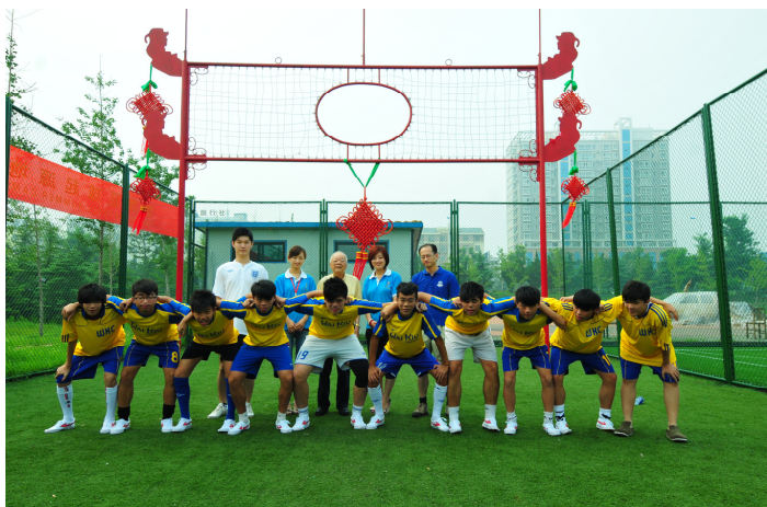
本校學生在賽前均氣志高昂