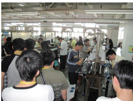
同學參觀內地廠房情況