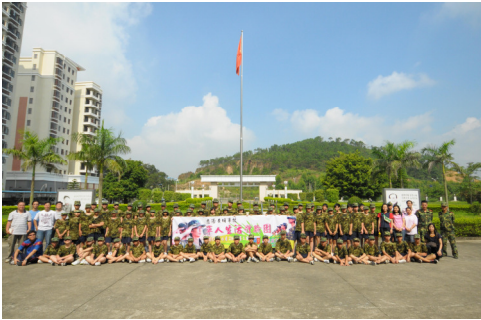
全體師生在軍校拍下大合照