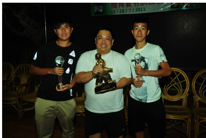
足球冠軍盃及蹴鞠季軍盃