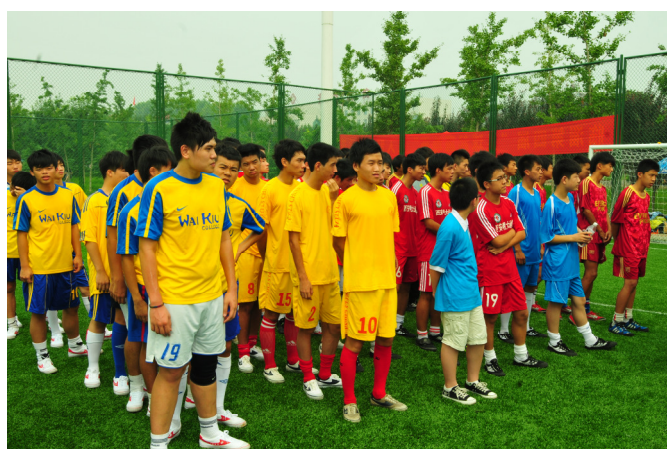
比賽前各支隊伍的陣容