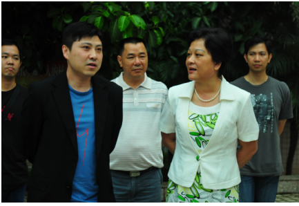
惠陽區區長親臨軍校視察學生情況