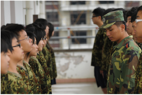
學生聆聽教官的指令