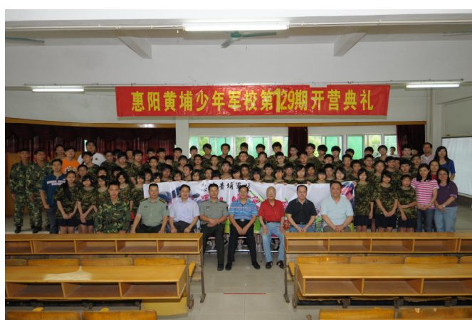
開營典禮後軍校教官與學生大合照