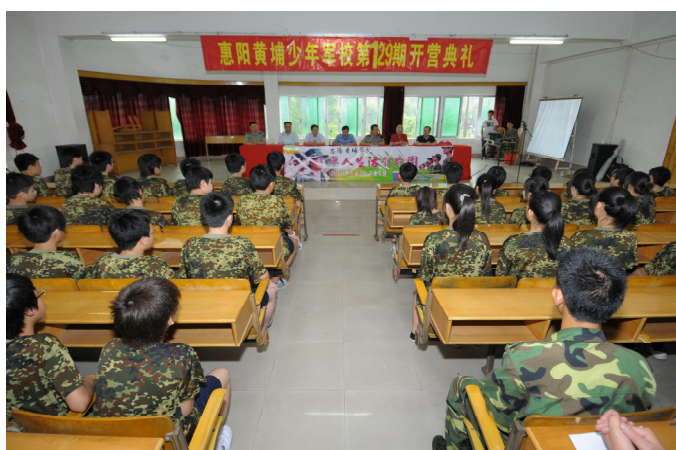
學生出席開營典禮