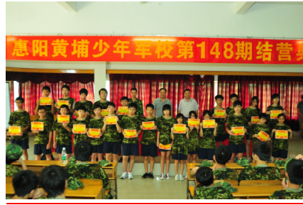
結業禮中頒發證書給優異學生