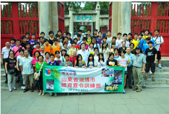
在曲阜孔廟前合照

是次活動除了提高學生的運動水平，發揚本校立足香港、放眼世界的辦學宗旨外，還加深學生對曲阜、泰山、青島三大城市的發展及過往的歷史。