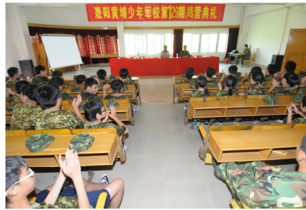
學生出席結營典禮，拍掌祝賀完成訓練